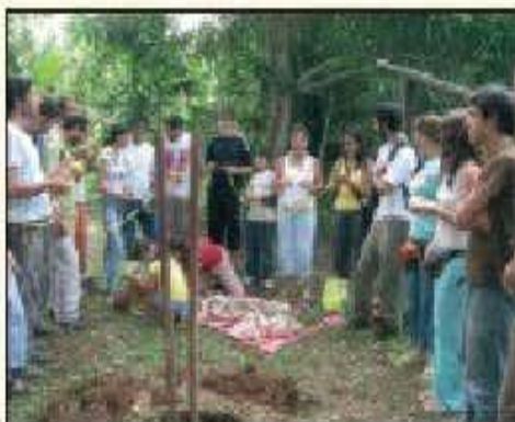
Niños y adultos celebran el Día de la Tierra.

Uno de los lugares más visitados fue el Centro de Cuidado de los Animales. Chicos y grandes pudieron